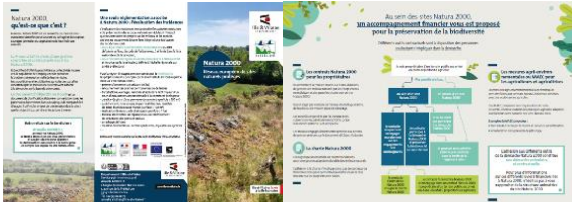
Plaquette de présentation de la démarche Natura 2000