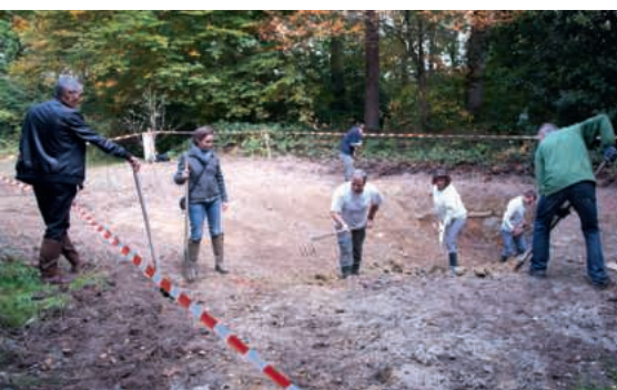
Chantier bénévole participatif.

Sur proposition de l'association Bretagne Vivante, et avec l'appui technique du Département en tant qu'animateur du site Natura 2000, les agents du centre d'exploitation des voies navigables de la Région Bretagne ont décidé de creuser deux mares en bordure de l'étang de Bazouges. Des bénévoles sont ensuite intervenus pour profiler les berges de manière à les rendre plus accessibles à la faune